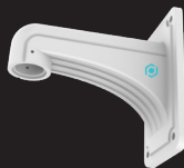
WMB6 SUPPORT MURAL