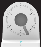
WMB5 SUPPORT MURAL