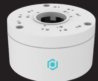
TEBBASE1 BOÎTE DE JONCTION