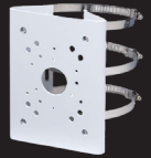
PMB6 SUPPORT POUR POTEAU