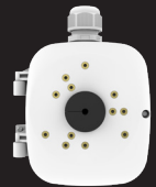
B6BASE1 BOÎTE DE JONCTION