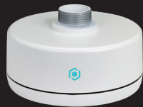
CMB6-G SUPPORT AU PLAFOND