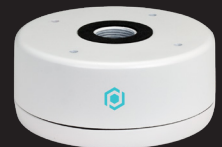
EB3BASE4 BOÎTE DE JONCTION